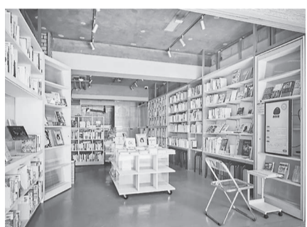
無人営業を行う透明書店