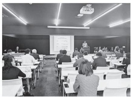
事前に行われた説明会